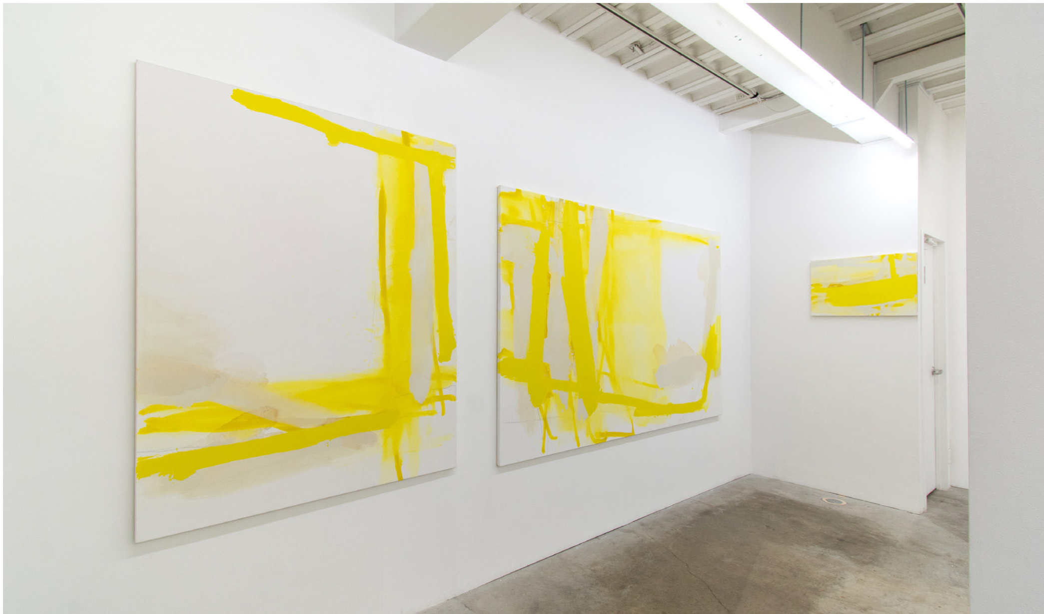
《黄の水路》(4点組のうち3点のみ展示)