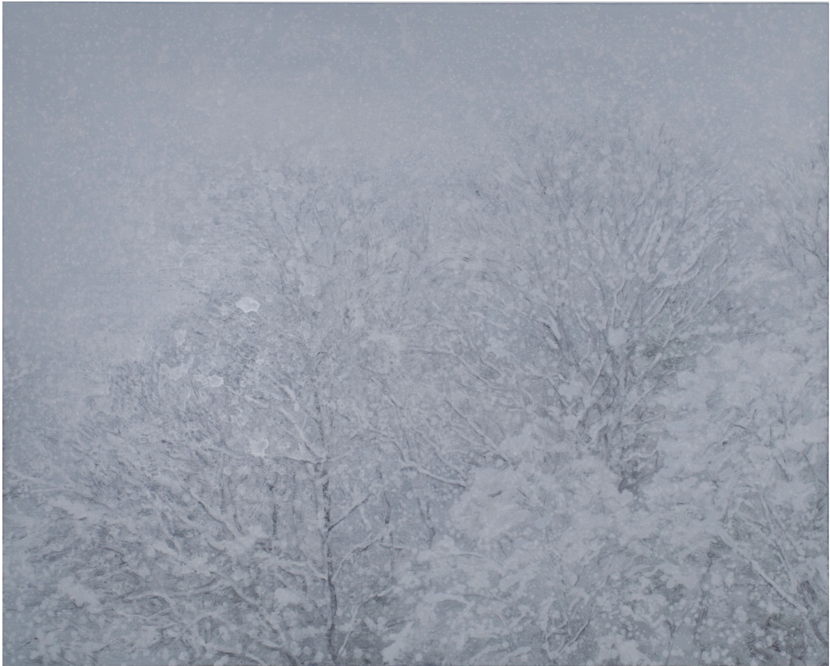
深韻 水の系譜 - 白六

Deep Rhyme - the note of water (whiteout) 6 130.5 x 162 cm, oil on canvas, 2016