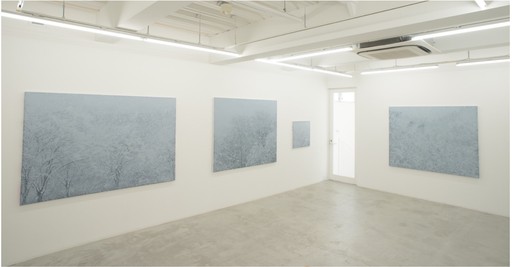
深韻 - 白 - | Deep Rhyme - whiteout Installation view at MEM, Tokyo, 2016