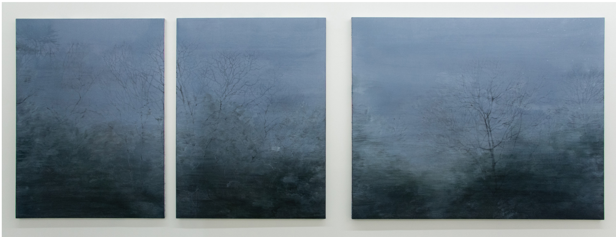
深韻—水の系譜 (霧雨) 二十四、二十五

2017, キャンバスに油彩 / Oil on canvas, 130.3x97cm, 130.3x97cm, 130.3x162cm