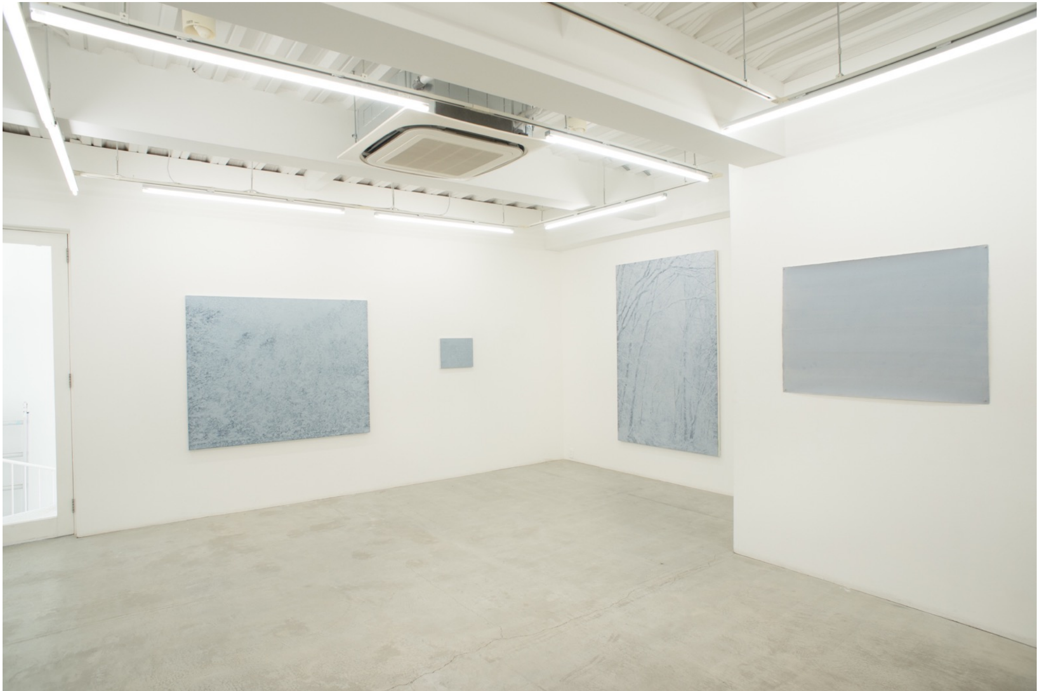
深韻 - 白 - | Deep Rhyme - whiteout Installation view at MEM, Tokyo, 2016