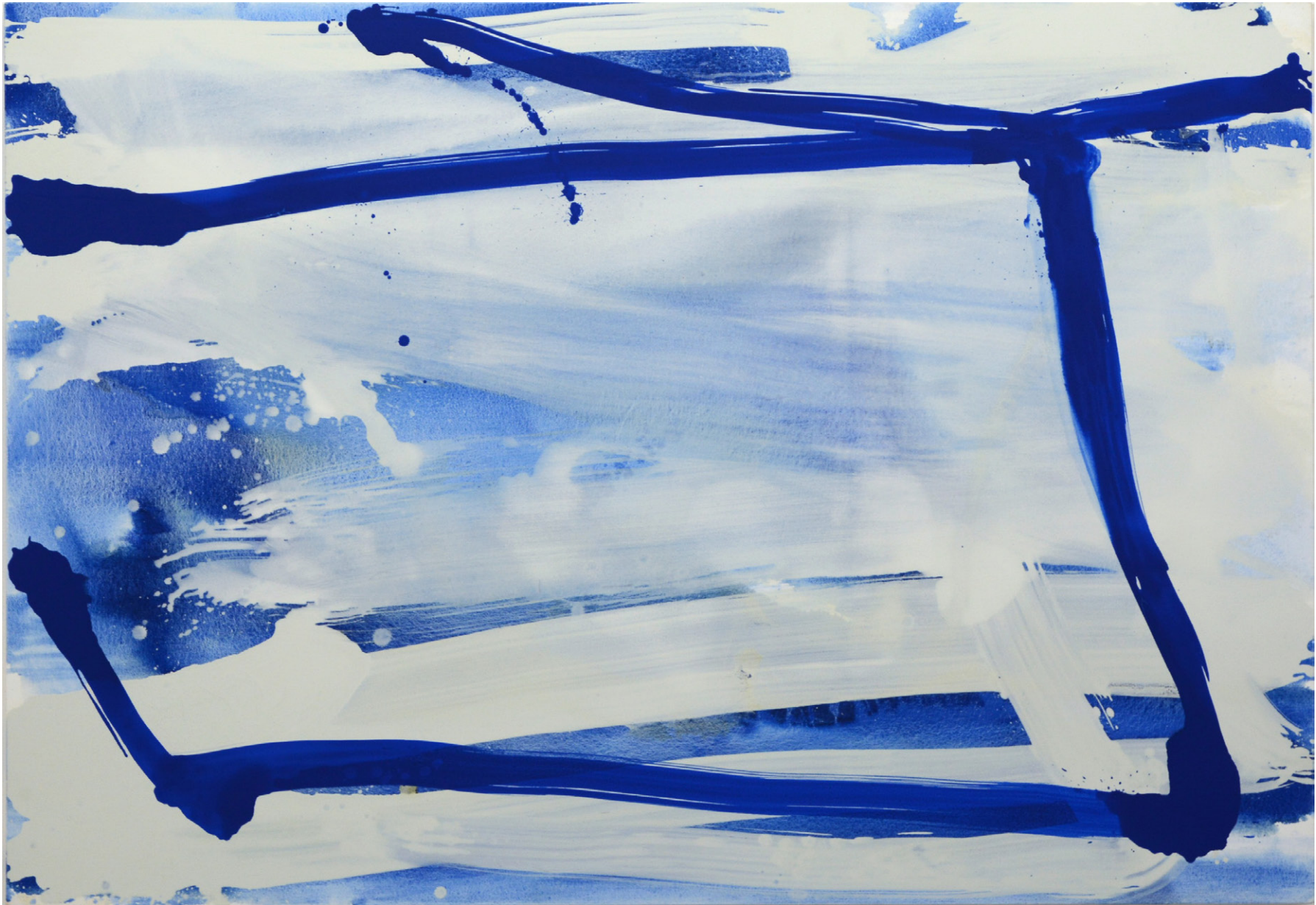
Step by Step

1997, キャンバスに油彩 / Oil on canvas, 112 × 162cm