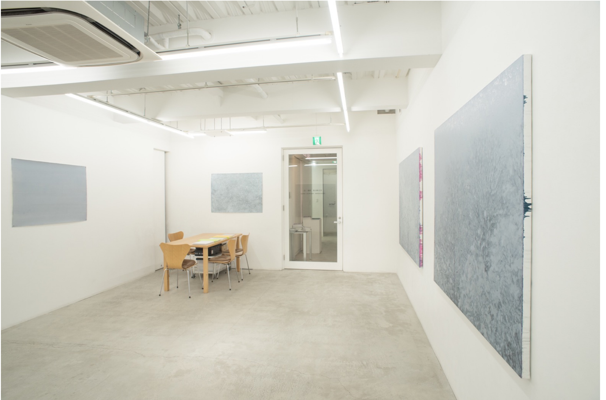
深韻 - 白 - | Deep Rhyme - whiteout Installation view at MEM, Tokyo, 2016