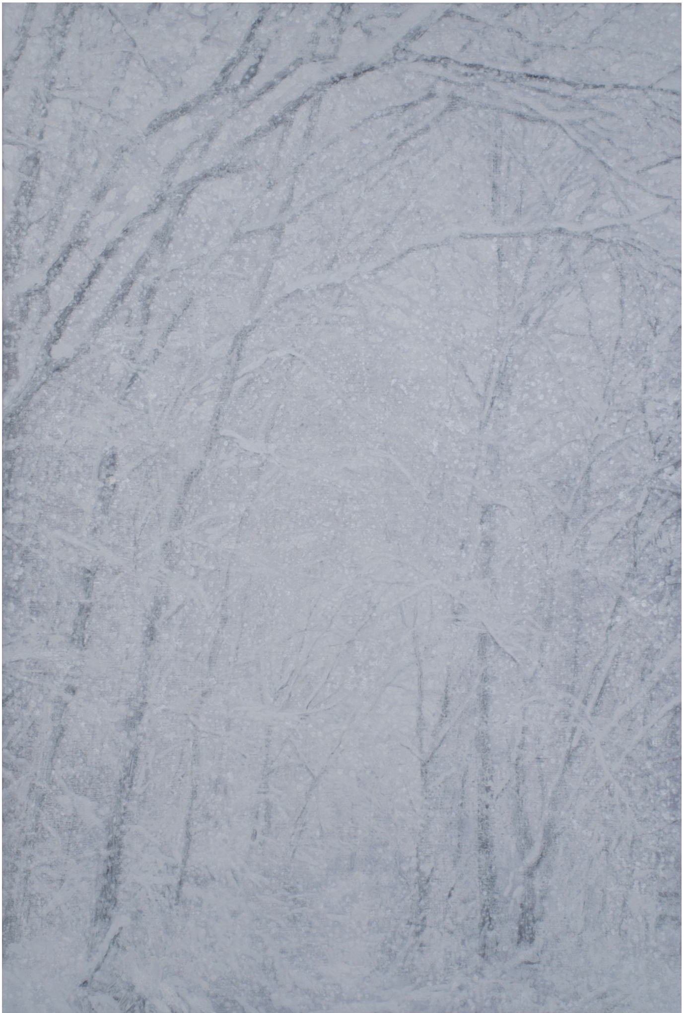
深韻 水の系譜 - 白十一

Deep Rhyme – the note of water (whiteout) 11 194 x 130.5 cm, oil on canvas, 2016