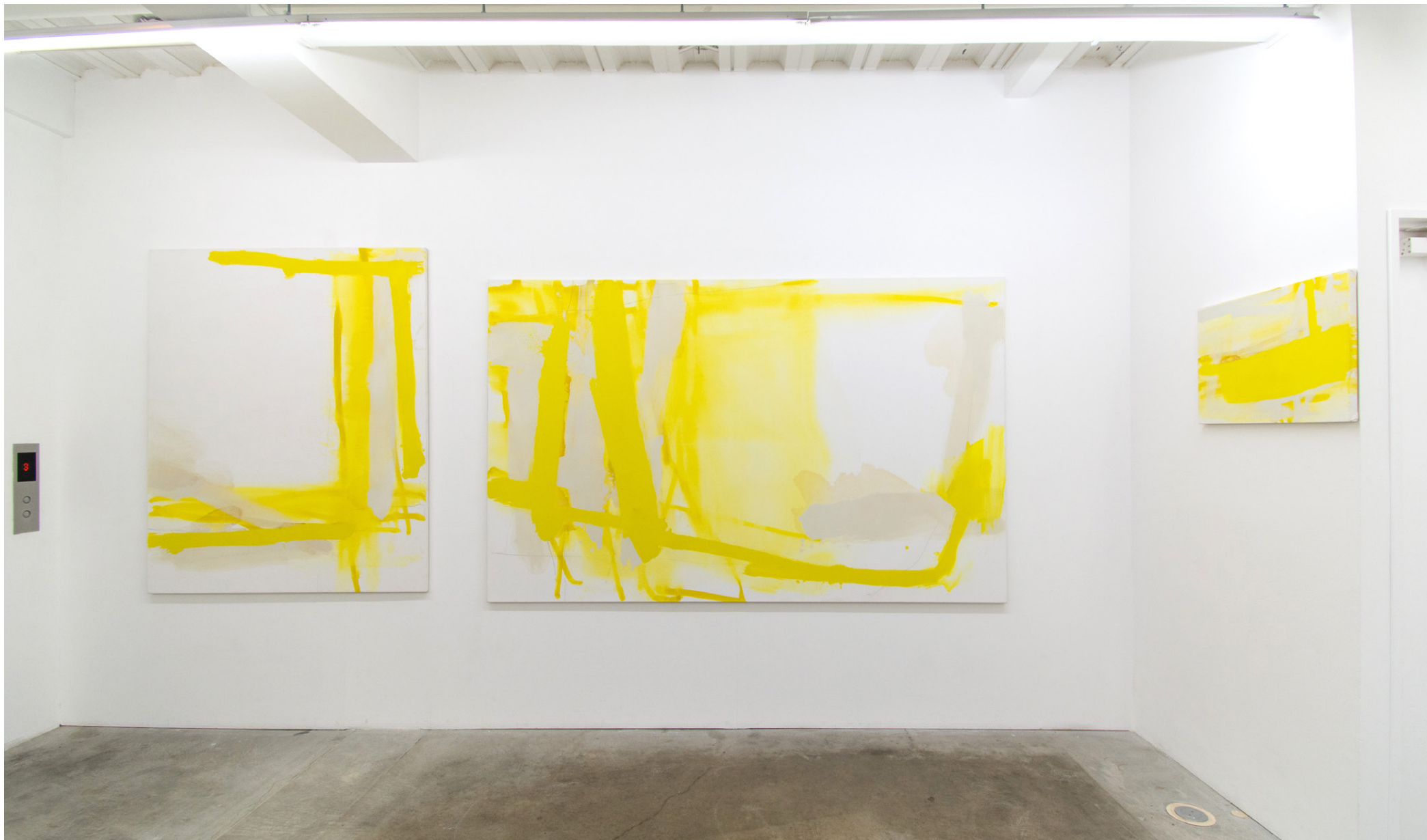
《黄の水路》(4点組のうち3点のみ展示)