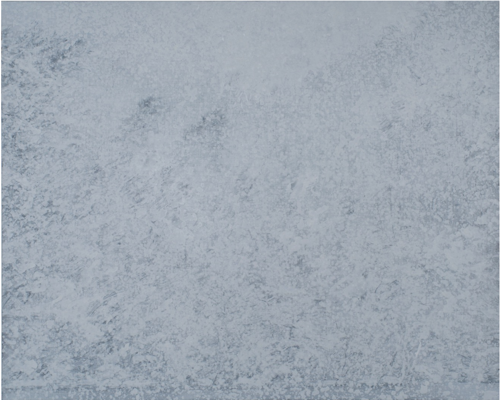
深韻 水の系譜 - 白 十二

Deep Rhyme - the note of water (whiteout) 12 130.5 x 162 cm, oil on canvas, 2016