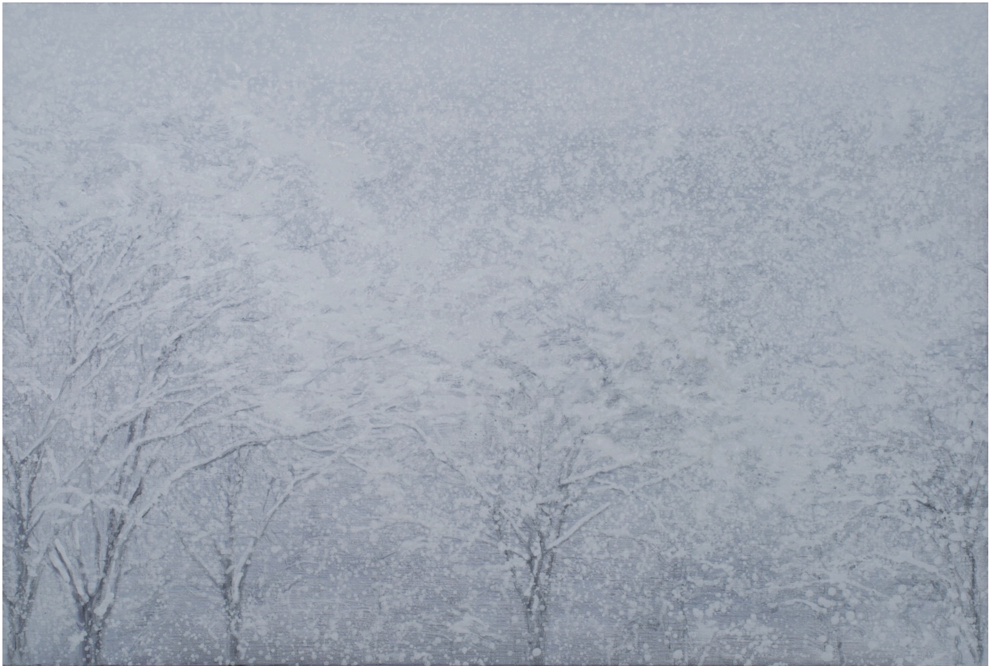
深韻 水の系譜 - 白十

Deep Rhyme - the note of water (whiteout) 10 130.5 x 194 cm. oil on canvas. 2016