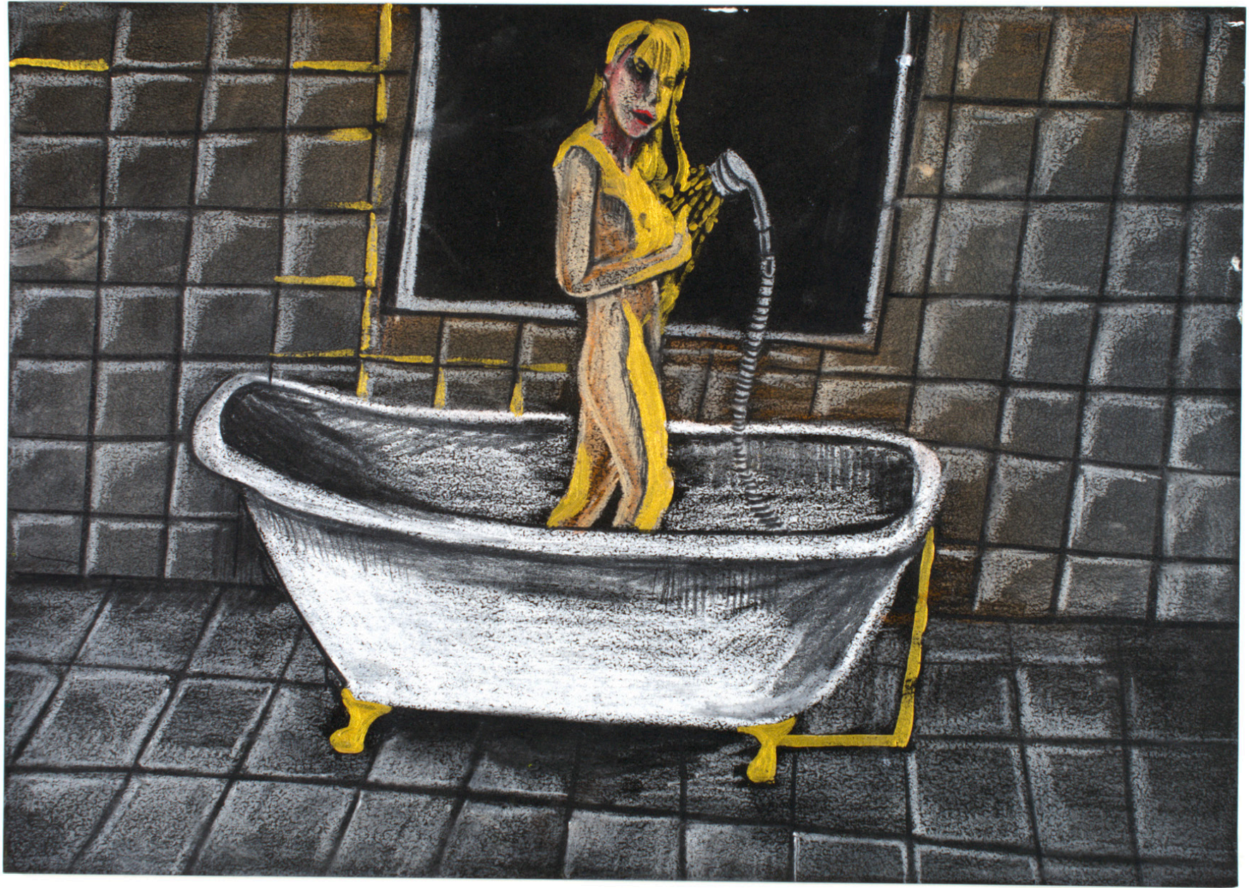
「シャワーを浴びて金になる」のためのドローイング