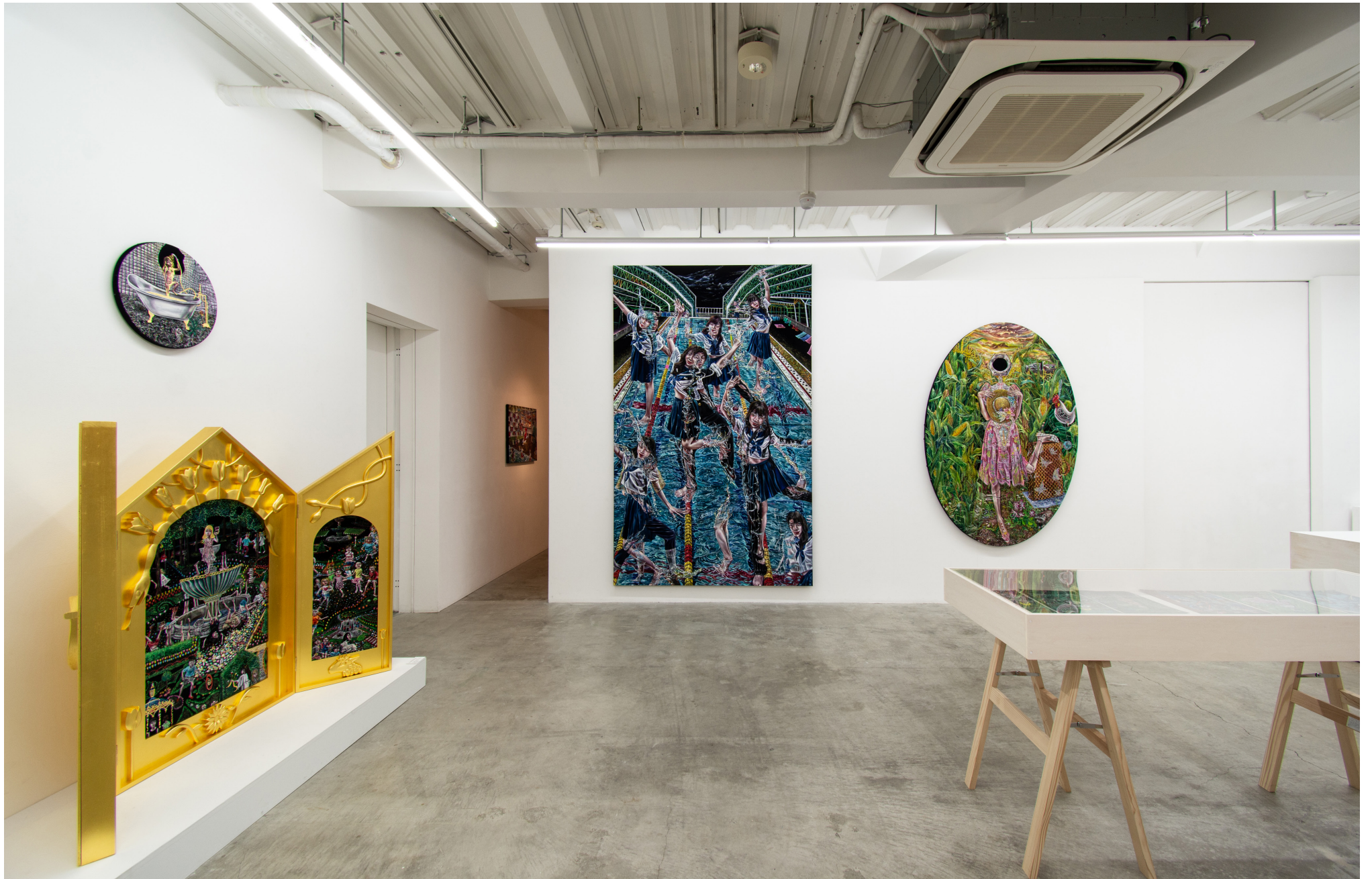
Installation view at MEM, Tokyo