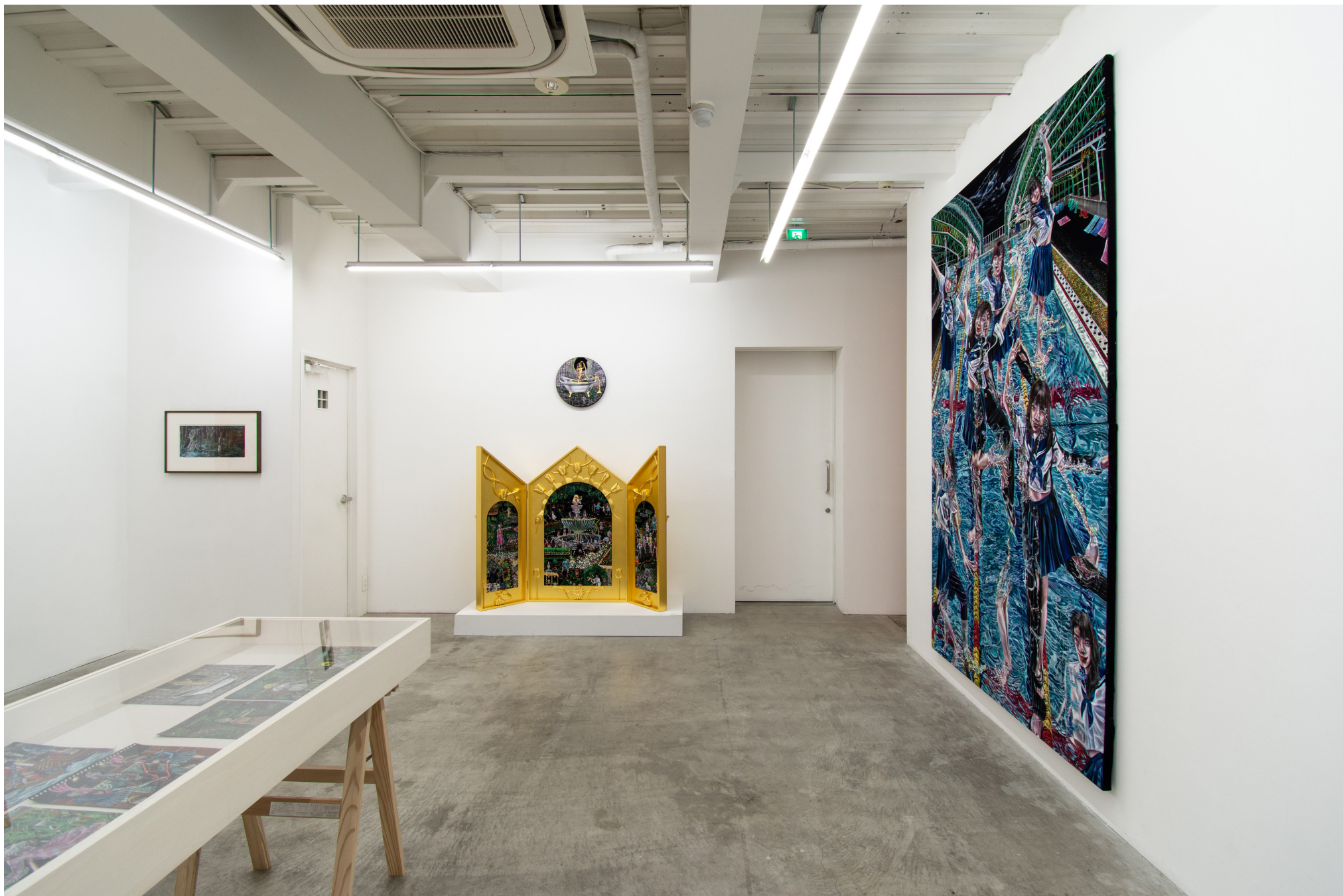
Installation view at MEM, Tokyo