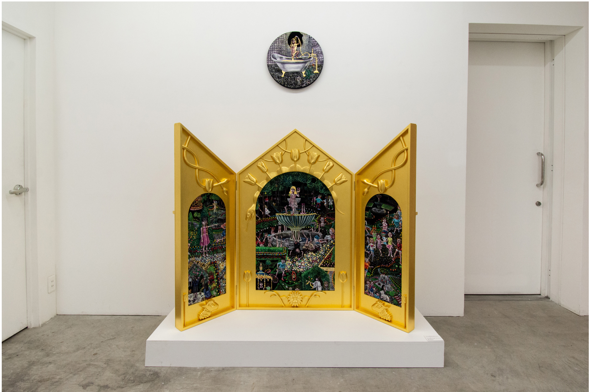
Installation view at MEM, Tokyo