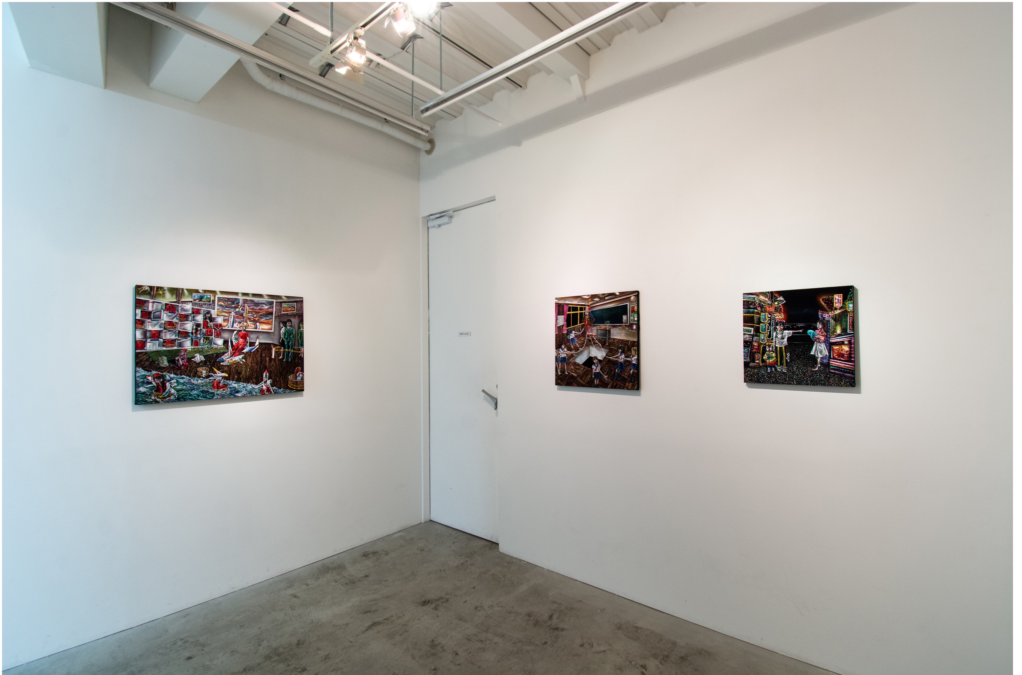
Installation view at MEM, Tokyo