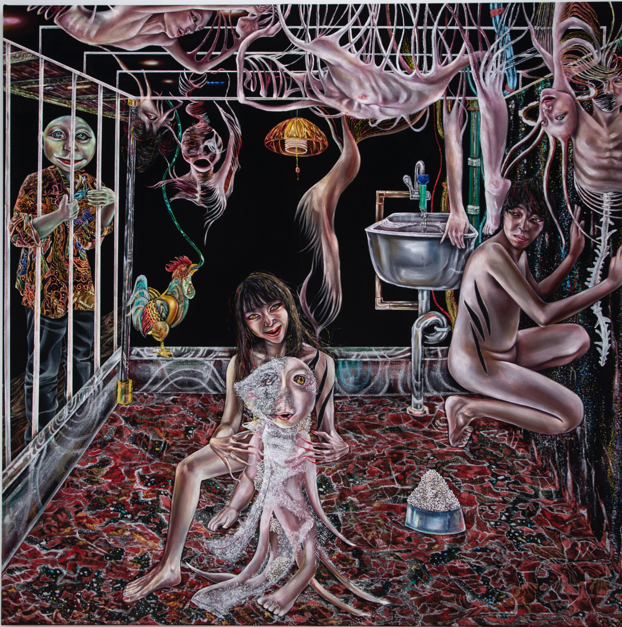
ごらん、世界は美しい Behold, This Beautiful World

ベルベットに油彩、アクリル、オイルパステル、グリッター Oil, acrylic, oil pastel and glitter on velvet