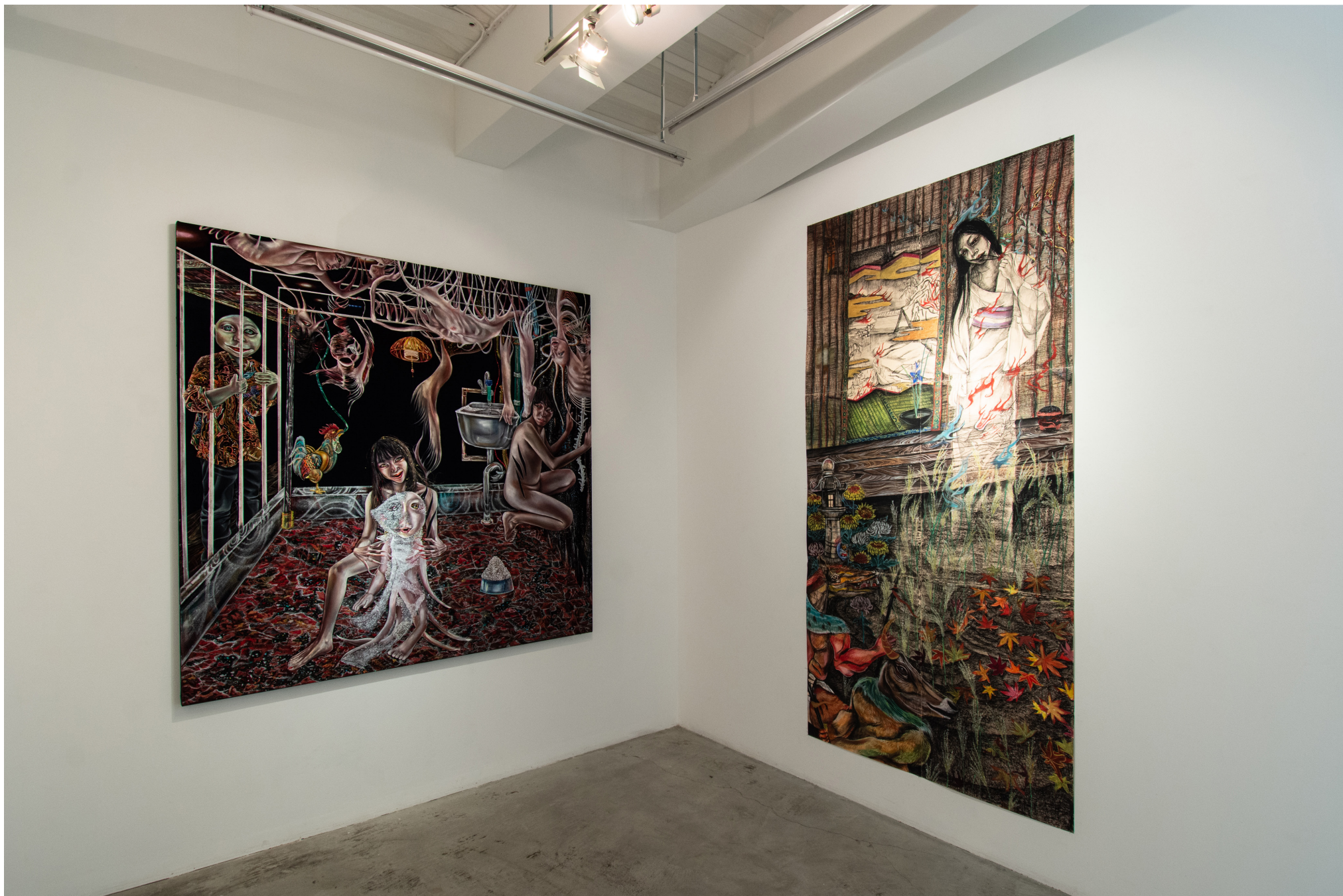
Installation view at MEM, Tokyo