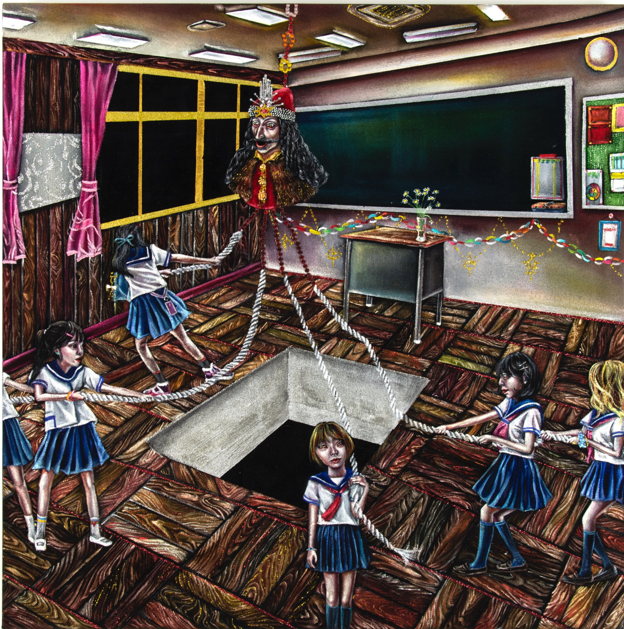
放課後の生贄 After-school Sacrifice

ベルベットに油彩、アクリル、グリッター、ラインストーン Oil, acrylic, glitter, rhinestone on velvet 53 × 53cm, 2021