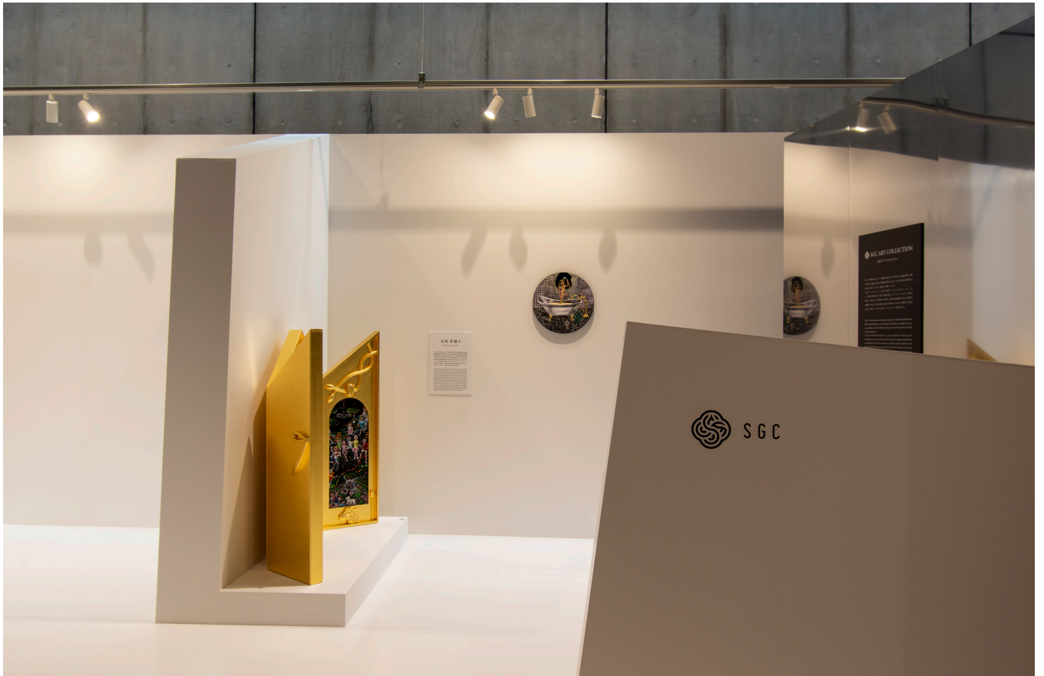
Installation view at Art Collaboration Kyoto 2022 Special Programs: SGC ART COLLECTION 2022年11月17日-20日 国立京都国際会館、京都