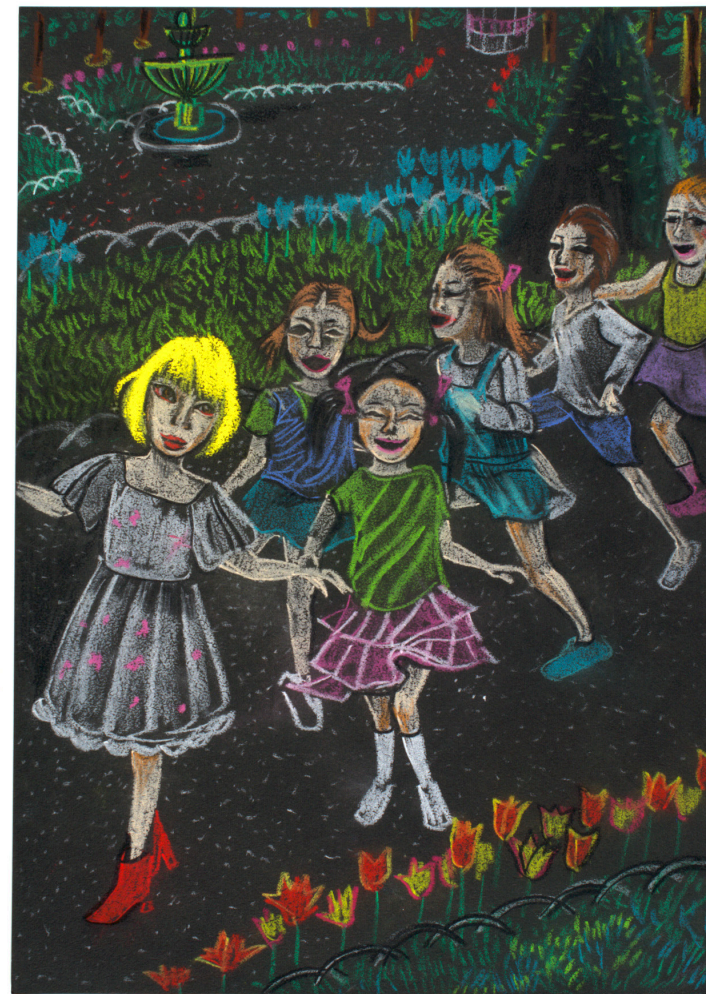
「パンドラの匣を開けて眠りましょう」のためのドローイング