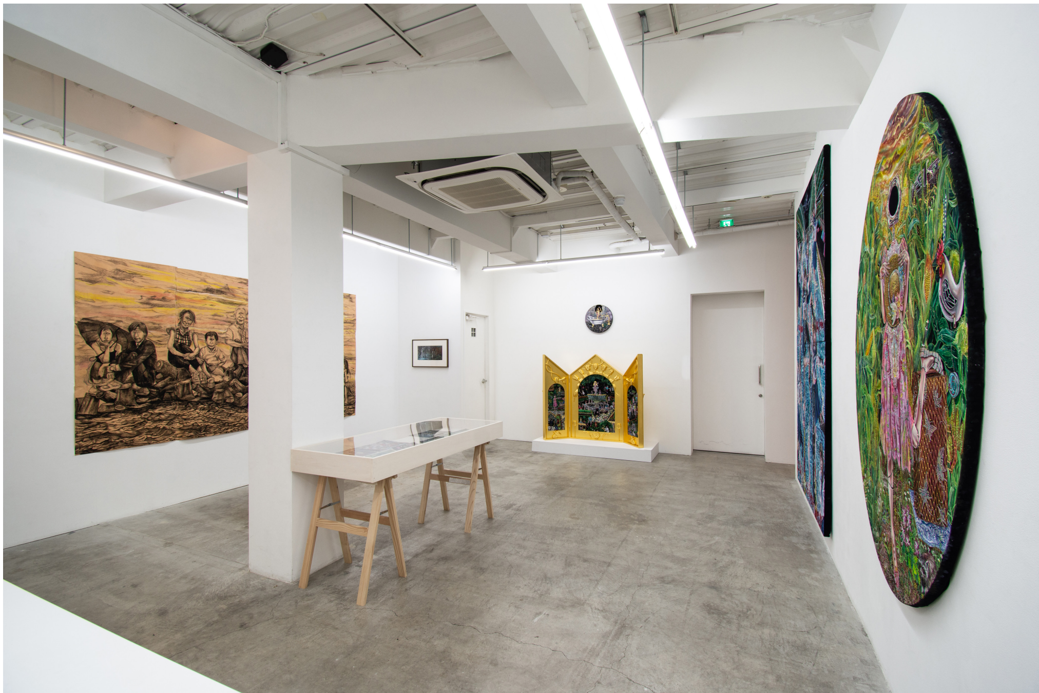
Installation view at MEM, Tokyo