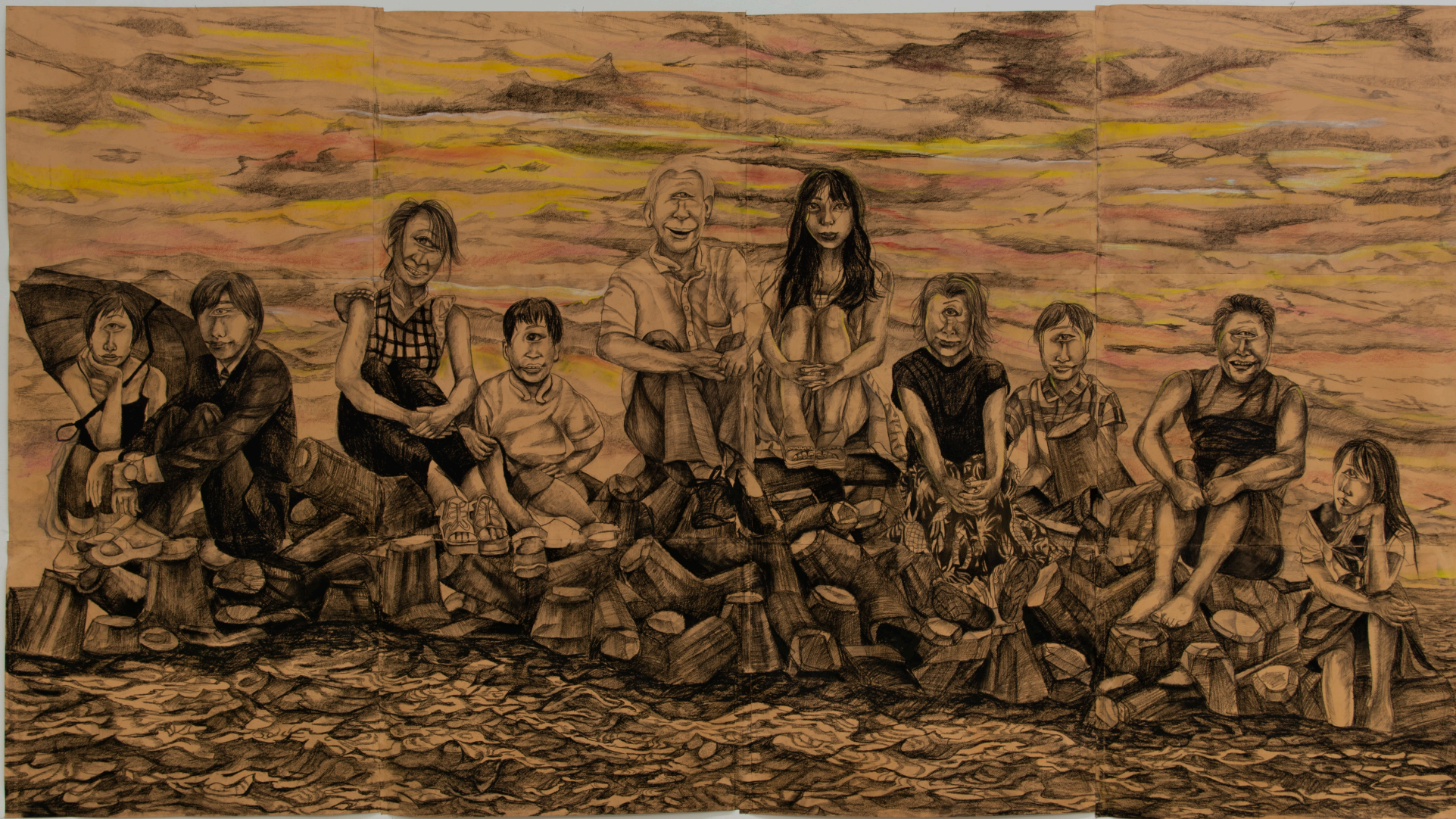
彼の地 Their Land

紙にパステル Pastel on paper 161 × 292.6cm, 2022