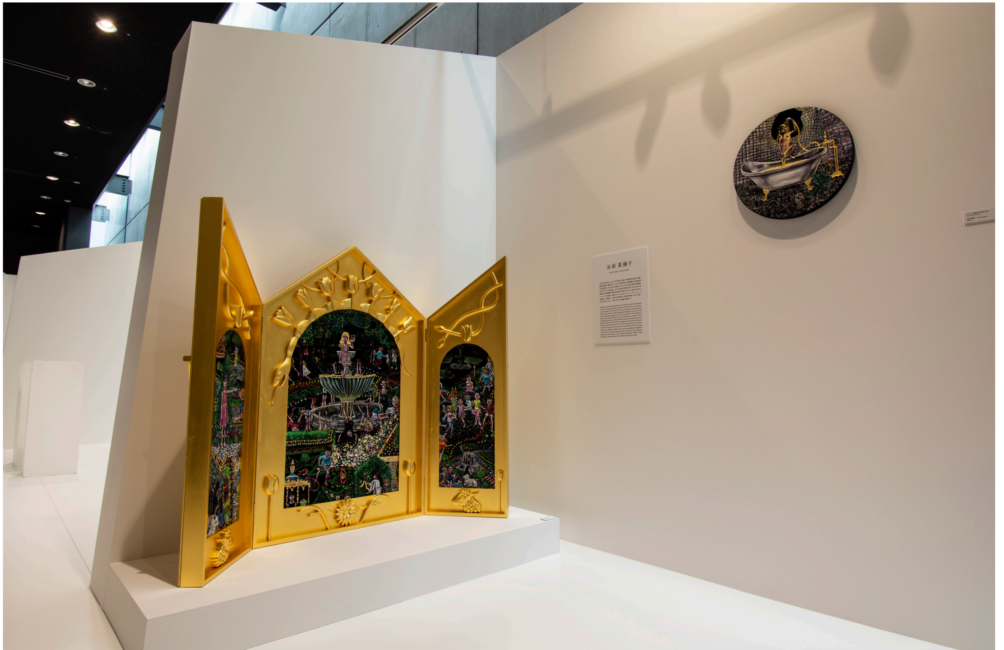
Installation view at Art Collaboration Kyoto 2022 Special Programs: SGC ART COLLECTION 2022年11月17日-20日 国立京都国際会館、京都